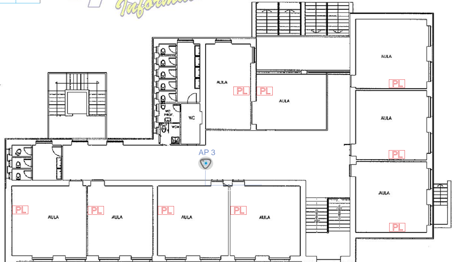
Progetto schematico esecutivo riferito al plesso Cesare Battisti - Piano Primo